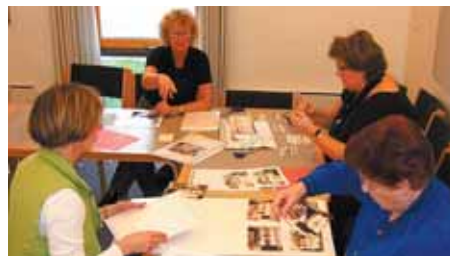
Menighedsrådsmedlemmer i gang med at rydde op i kirkecentret.