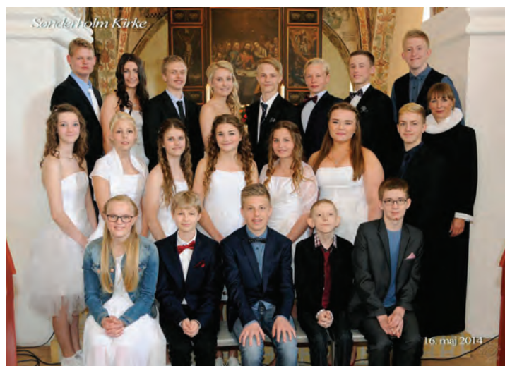
Sønderholm Kirke, 16. maj 2014