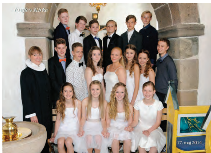
Frejlev Kirke, 17. maj 2014