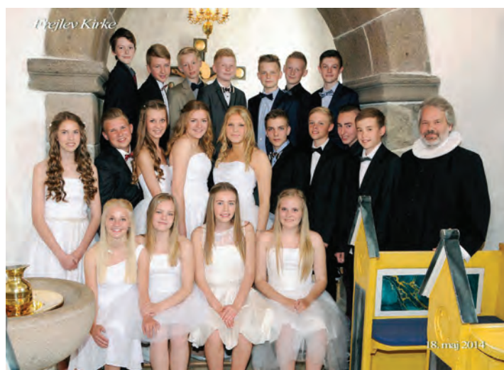
Frejlev Kirke, 18. maj 2014