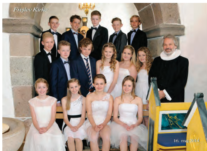
Frejlev Kirke, 16. maj 2014