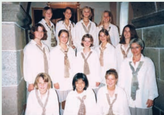
Jubilæumskoncert med Frejlev kirkes Pigechor. 25. august kl. 14.30