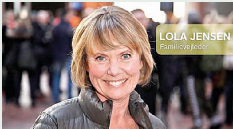
Familien Danmarks hverdag sat på humoristisk spids. 26. september kl. 19.00