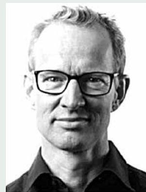
»Hurra for Halfdan« ved Helge Teglgaard. 15. november kl. 19.30