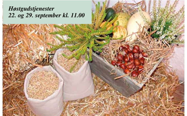
Høstgudstjenester 22. og 29. september kl. 11.00