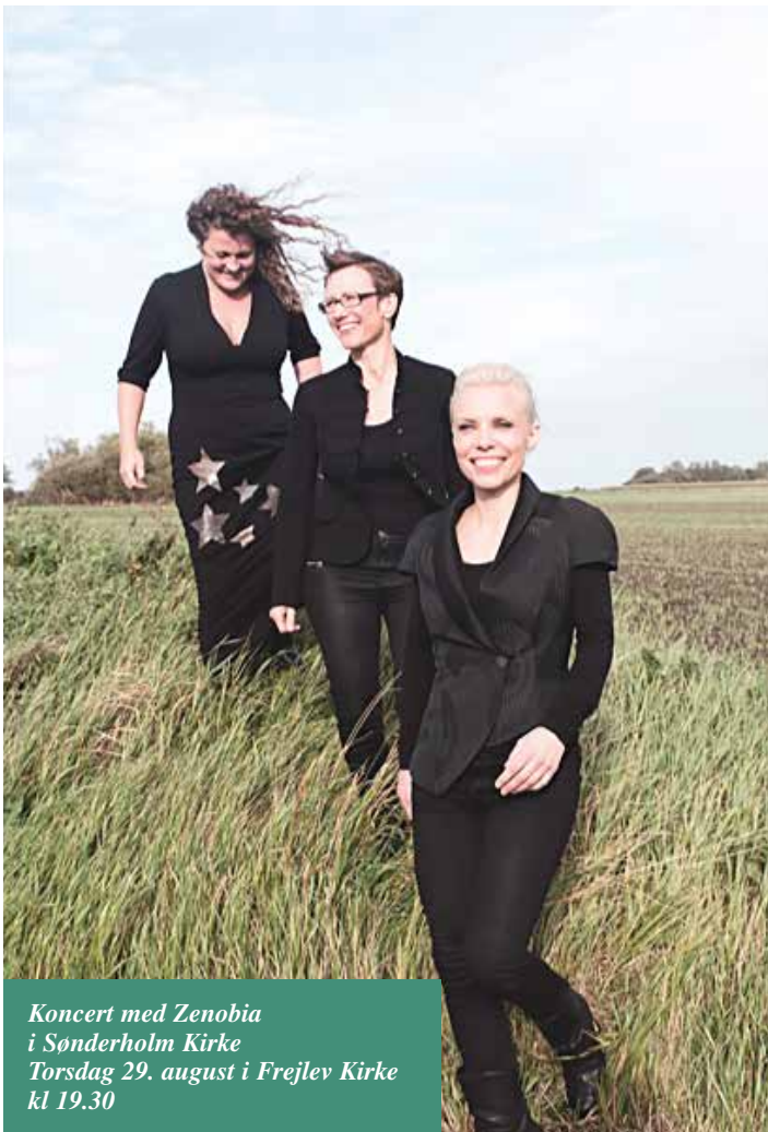
Koncert med Zenobia i Sønderholm Kirke Torsdag 29. august i Frejlev Kirke kl 19.30