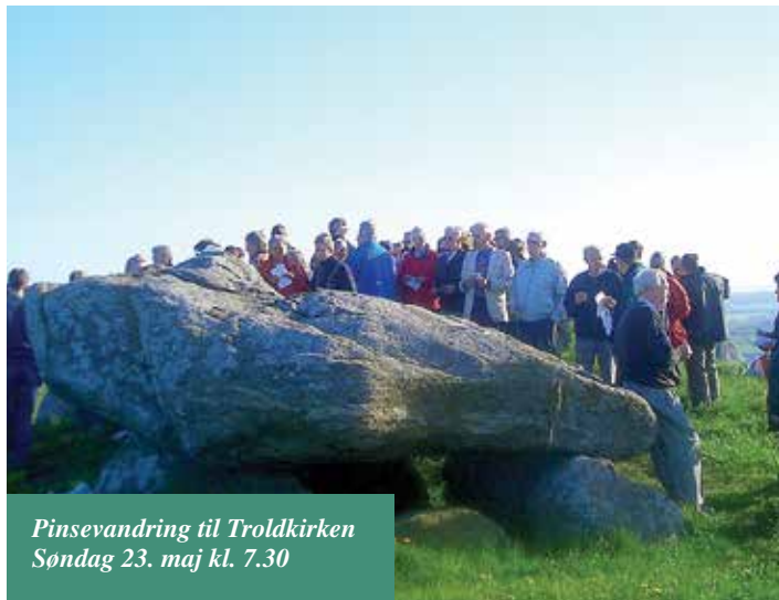
Pinsevandring til Troldkirken Søndag 23. maj kl. 7.30