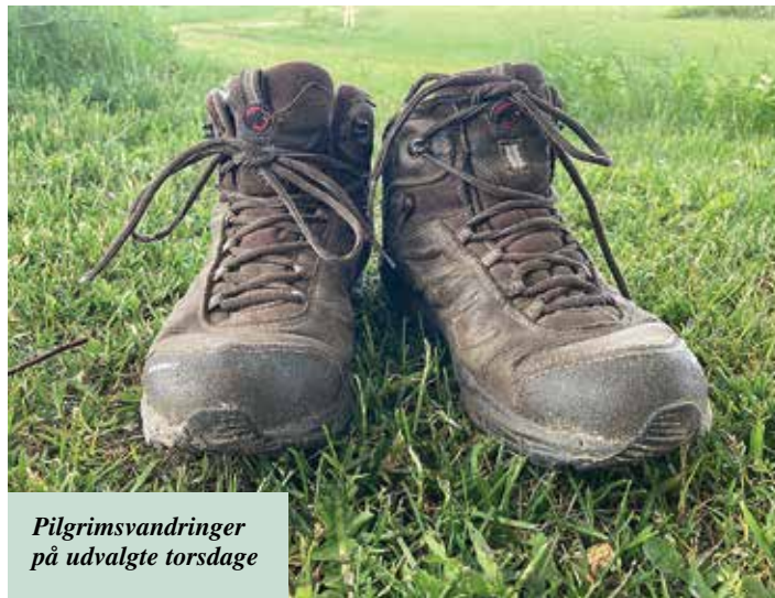
Pilgrimsvandring på udvalgte torsdage