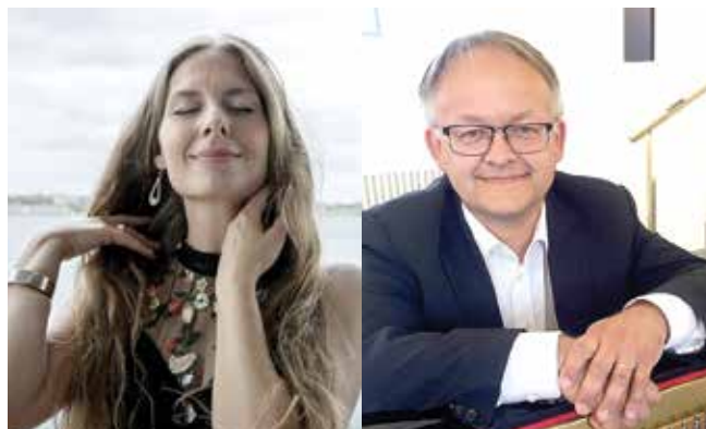
Den Blå Time - Kærlighedens veje og vildveje 9. marts kl. 17.00 i Sønderholm Kirke