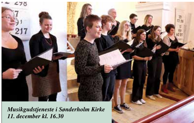
Musikgudstjeneste i Sønderholm Kirke 11. december kl. 16.30

Nr. 61 · December 2022 - Januar - Februar - Marts 2023