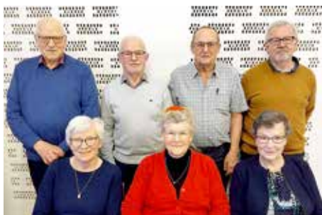
Sønderholm-Frejlev Seniorers nyvalgte bestyrelse