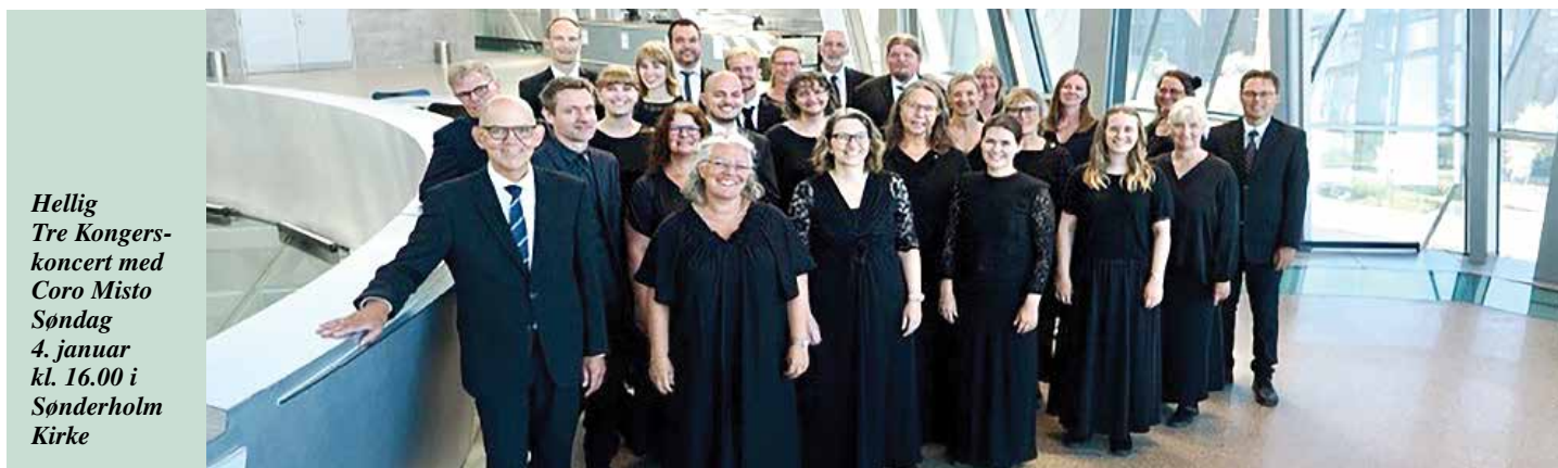
Hellig Tre Kongers- koncert med Coro Misto Søndag 4. januar kl. 16.00 i Sønderholm Kirke