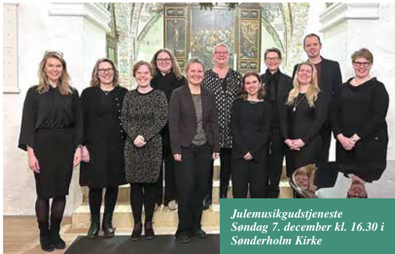
Julemusikgudstjeneste Søndag 7. december kl. 16.30 i Sønderholm Kirke

Nr. 70 · December 2025 - Januar - Februar - Marts 2026