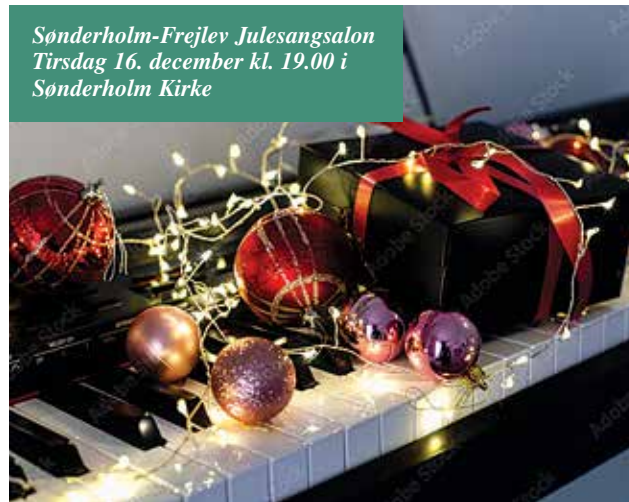
Sønderholm-Frejlev Julesangsalon Tirsdag 16. december kl. 19.00 i Sønderholm Kirke